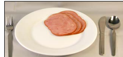
Grande (6 ounces)