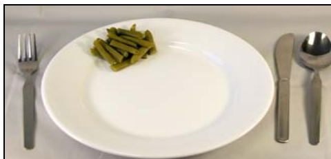
Pequeña (1/4 cup)