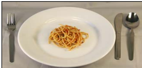
Pequeña (1/2 cup)