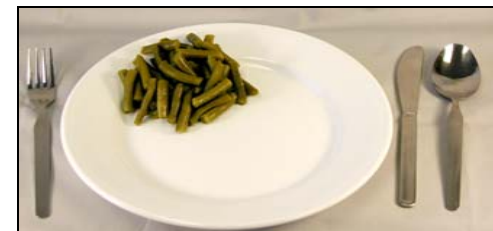
Grande (3/4 cup)