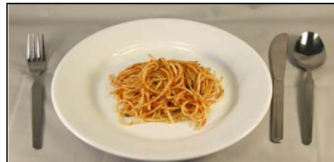
Mediana (1 cup)