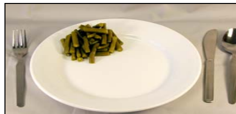
Mediana (1/2 cup)