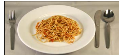
Grande (1 1/2 cups)